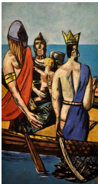
Départ – Max BECKMANN (1932-33) Triptyque – Panneau central.